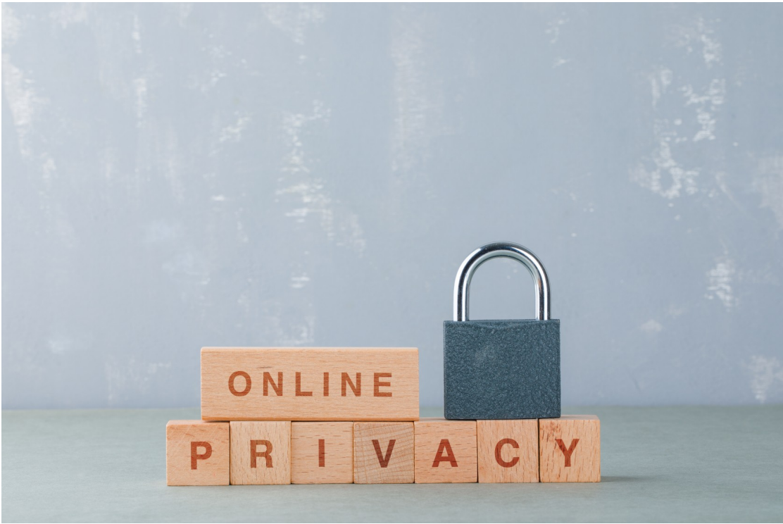
Privacidad online.