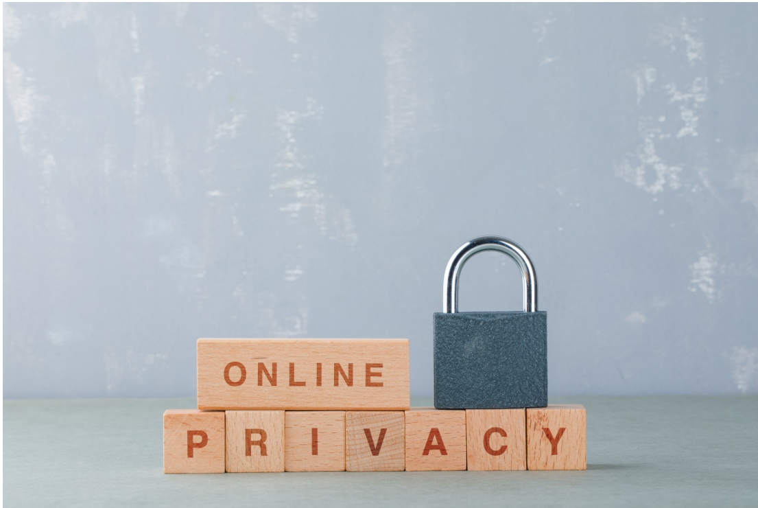
Privacidad online.