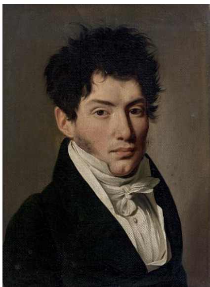
Charles Louis Havas.

Gracias a su trabajo, hoy en día podemos disfrutar de empresas como Reuters, Agence France-Presse (AFP), Associated Press (AP), EFE, Deutsche Press Agentur (DPA) y tantas otras.