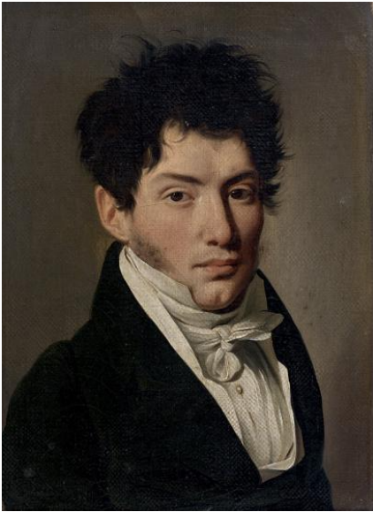
Wikipedia. Charles Louis Havas.

temporada, pero acabaron independizándose para volver a sus naciones, y de ese modo, fundar sus agencias de noticias.