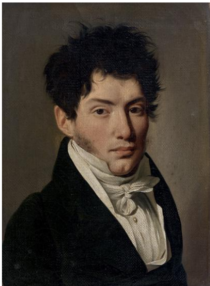
Charles Louis Havas.

Gracias a su trabajo, hoy en día podemos disfrutar de empresas como Reuters, Agence France-Presse (AFP), Associated Press (AP), EFE, Deutsche Press Agentur (DPA) y tantas otras.