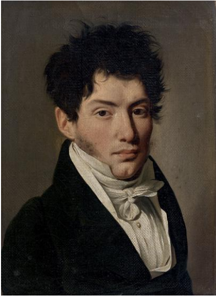
Charles Louis Havas.

Gracias a su trabajo, hoy en día podemos disfrutar de empresas como Reuters, Agence France-Presse (AFP), Associated Press (AP), EFE, Deutsche Press Agentur (DPA) y tantas otras.