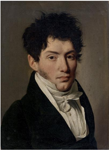
Charles Louis Havas.

Gracias a su trabajo, hoy en día podemos disfrutar de empresas como Reuters, Agence France-Presse (AFP), Associated Press (AP), EFE, Deutsche Press Agentur (DPA) y tantas otras.