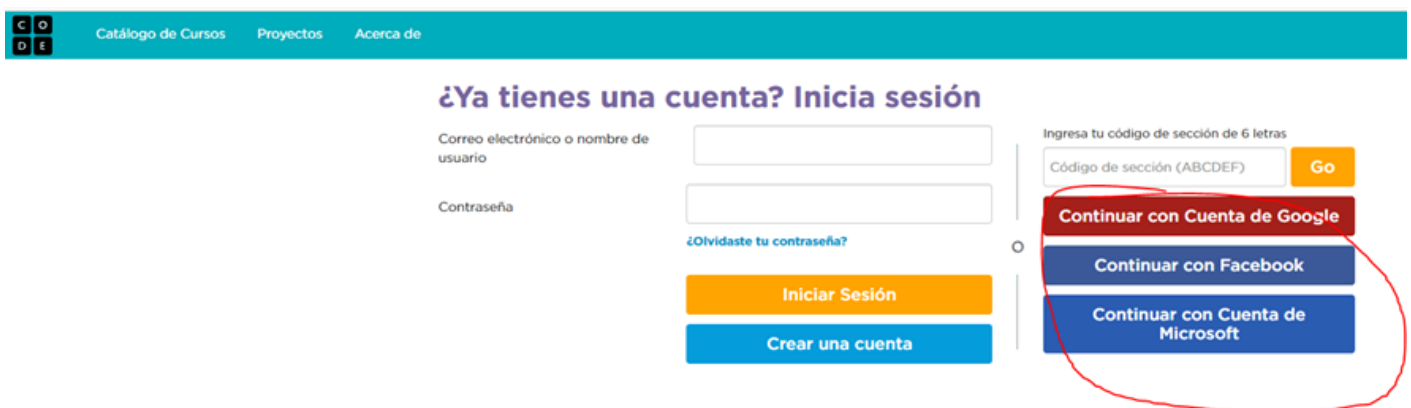
Code.org Acceso con cuentas de Redes Sociales. Imagen tomada para este curso.

En el ejemplo anterior de la plataforma code.org , también existe la opción de iniciar sesión a través de las redes sociales.