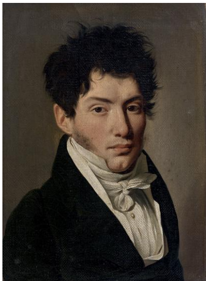
Charles Louis Havas.

Gracias a su trabajo, hoy en día podemos disfrutar de empresas como Reuters, Agence France-Presse (AFP), Associated Press (AP), EFE, Deutsche Press Agentur (DPA) y tantas otras.