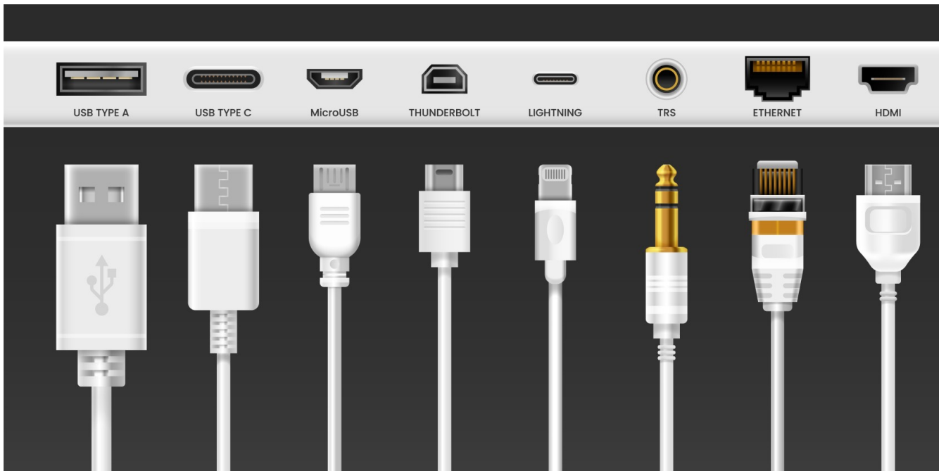
Diversidad de cableado informático.