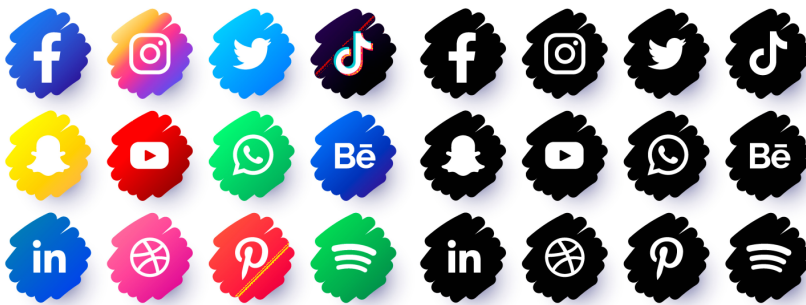
SOCIAL MEDIA LOGO COLLECTION

Freepik . Logos de RRSS. myriaammira. (CC BY-SA)