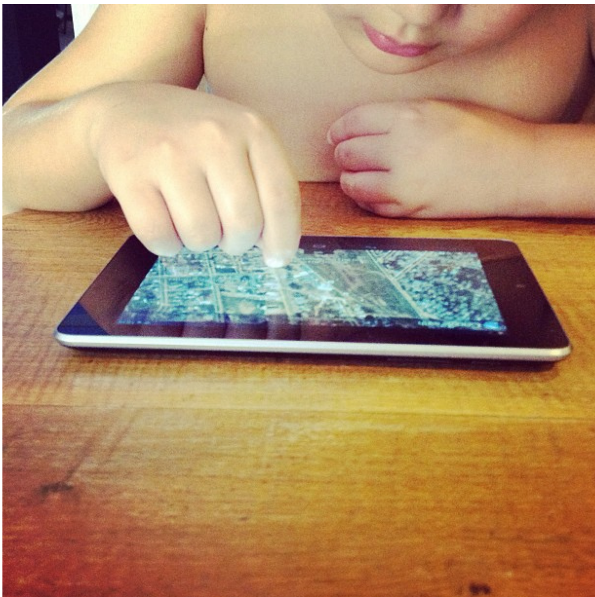
Imagen de Mercedes Kamijo , 2013, CC BY-NC-SA 2.0