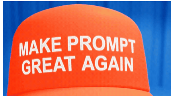
La IA de mitin (Minerva Rodríguez + Gemini + Hailou Ai)

El prompt no es solo una instrucción técnica; es una partitura textual que guía la alucinación de la IA. En el contexto artístico, el prompt crafting (la artesanía del comando) se convierte en una nueva forma de escritura creativa donde el artista debe dominar tanto la semántica como la estética técnica.