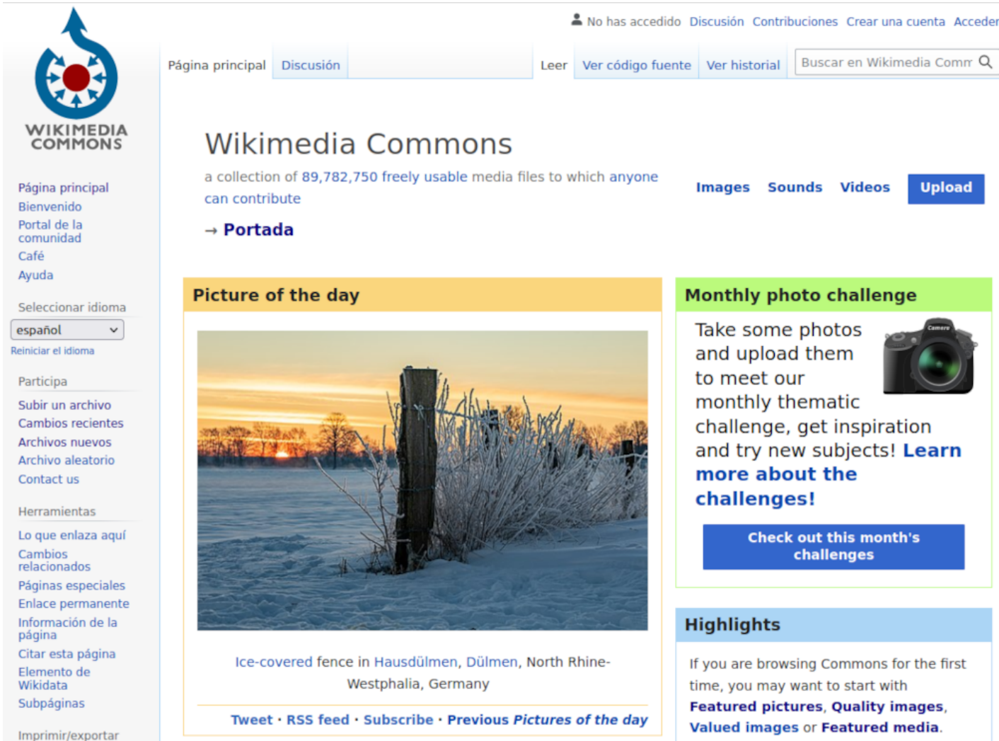
Fig. 2.