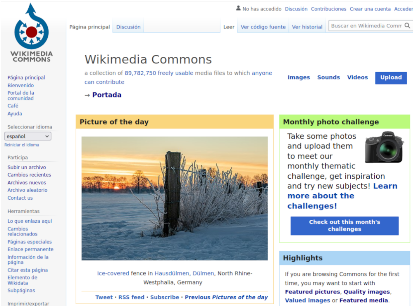
Fig. 2. Wikimedia Commons