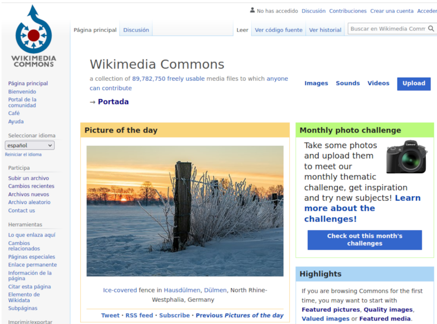
Fig. 2.