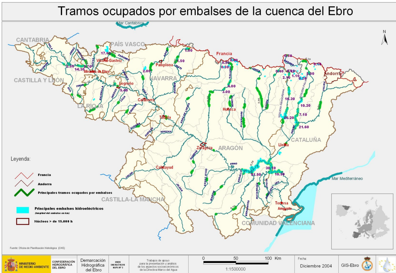
Figura 2. Mapa de embalses de la cuenca del Ebro.