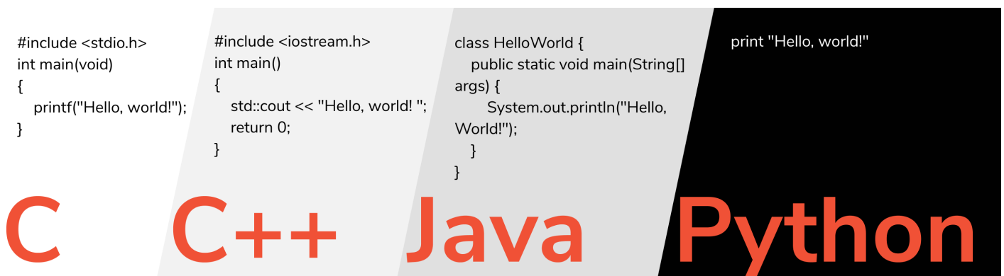
Figura 1. "Hello World" en cuatro lenguajes diferentes (C, C++, Java, Python)

Ejemplo de cómo imprimir en 4 lenguajes diferentes la misma frase "Hello World":