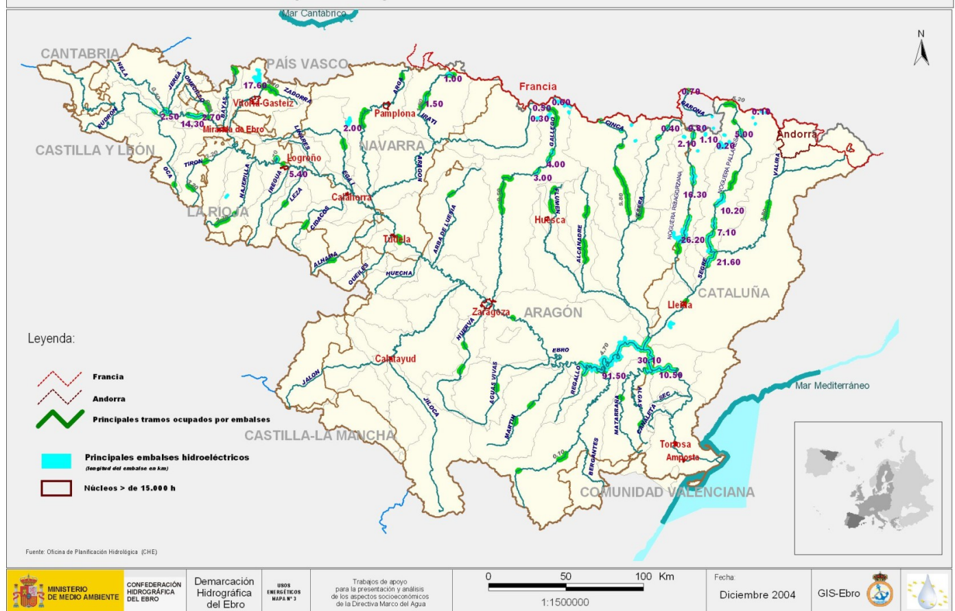
Figura 2. Mapa de embalses de la cuenca del Ebro.