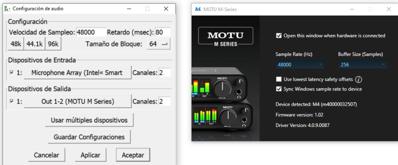
Figura 1. Configuración de audio de Pure Data (izquierda), configuración de tarjeta de sonido externa (derecha)

Es el número de valores por segundo que definen una onda. La mayoría de las tarjetas de sonido funcionan a 44.000 Hz , que es la frecuencia que viene predeterminada en la configuración de Pure data, o a 48.000 Hz . Tendréis que configurar este parámetro para que coincida con el de vuestra tarjeta de sonido. En mi caso utilizo una tarjeta de sonido externa que actualmente tengo configurada a 48 kHz, por lo que utilizaré la misma frecuencia en mi configuración de Pure Data.