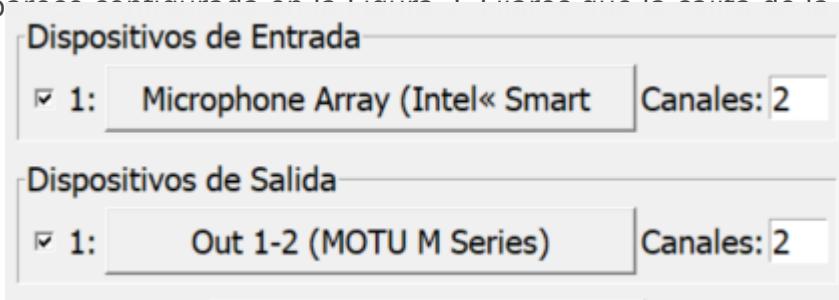
Figura 2. Dispositivos de entrada y

Aquí, podemos configurar qué entradas y a través de qué tarjeta vamos a recibir señal de audio en Pure Data, por ejemplo, el micrófono interno de vuestro ordenador. En mi caso, es la entrada que aparece configurada en la Figura 2. Fijaros que la casilla de la izquierda este activada.