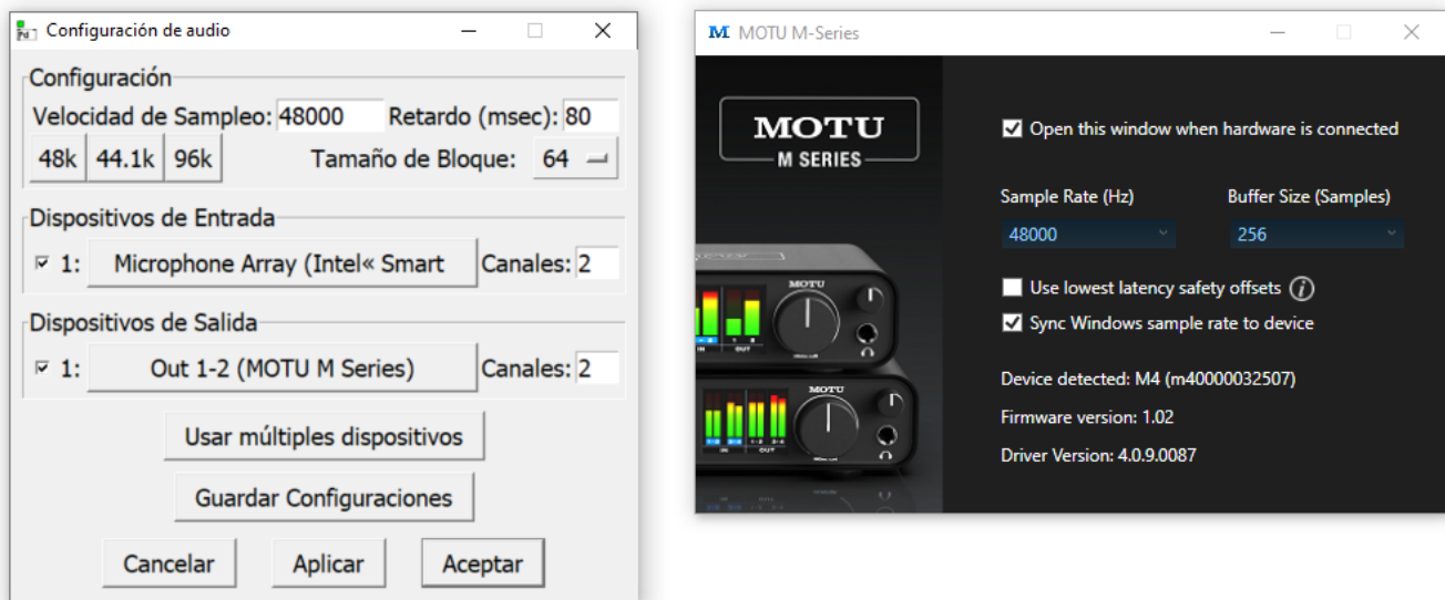
Figura 1. Configuración de audio de Pure Data (izquierda), configuración de tarjeta de sonido externa (derecha)

Es el número de valores por segundo que definen una onda. La mayoría de las tarjetas de sonido funcionan a 44.000 Hz , que es la frecuencia que viene predeterminada en la configuración de Pure data, o a 48.000 Hz . Tendréis que configurar este parámetro para que coincida con el de vuestra tarjeta de sonido. En mi caso utilizo una tarjeta de sonido externa que actualmente tengo configurada a 48 kHz, por lo que utilizaré la misma frecuencia en mi configuración de Pure Data.