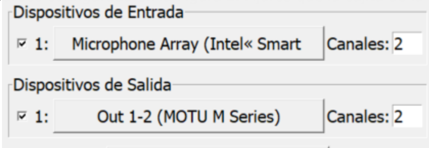
Figura 2. Dispositivos de entrada y

Aquí, podemos configurar qué entradas y a través de qué tarjeta vamos a recibir señal de audio en Pure Data, por ejemplo, el micrófono interno de vuestro ordenador. En mi caso, es la entrada que aparece configurada en la Figura 2. Fijaros que la casilla de la izquierda este activada.