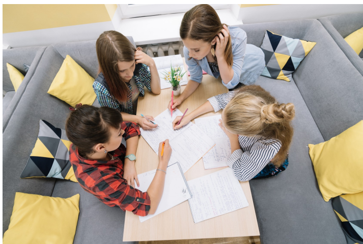
Imagen 1: Freepik

relaciones entre estos y los de los demás."