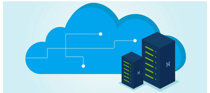
Ilustración de DemandSage

Un servidor local es aquel servidor que ha sido instalado en un equipo determinado del entorno con el fin de trabajar offline y online .