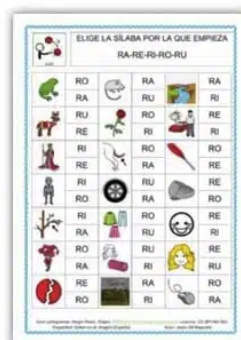
Elige la sílaba por la que empiezan los dibujos. RA RE RI RO RU por jgilale

Como la app se ha actualizado recientemente no hay disponibles tutoriales de la nueva versión , pero es muy intuitiva. De lo que sí hay tutoriales es de cómo ver las repuestas del 'profe' para aprobar tus exámenes... así que cuidado con el alumnado 'Hacker' que sabe buscar truquillos en youtube también