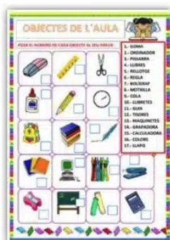
Poner número a los dibujos por bego1966