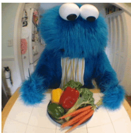
Cookie Monster Gtfoh

Es importante tener en cuenta que algunas cookies son necesarias para el funcionamiento básico de un sitio web . En estos casos, rechazar todas las cookies puede afectar negativamente la funcionalidad del sitio.