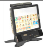
Ratón de mirada

Con un trackball, o ratón de bola, el usuario hace girar la bola con el pulgar, los dedos, la palma de la mano, e incluso el pie, para mover el cursor.