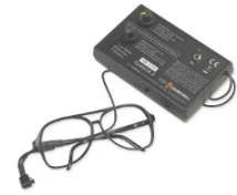
Pulsador de parpadeo

Un pulsador de pedal es un pulsador resistente que es operado por la presión del pie. Un ejemplo de uso es el control de una máquina herramienta, permitiendo que el operador tenga ambas manos libres para manipular la pieza de trabajo, muy útil para personas con movilidad superior reducida.