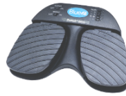
Pulsador de pie

Es un dispositivo que permite la comunicación entre la persona y la computadora. Al ejercer una mínima presión sobre el pulsador, éste emite una señal para interactuar con un programa determinado. El pulsador es ubicado de forma tal que la persona pueda accionarlo a través de un movimiento voluntario.