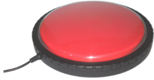
Pulsador de sobremesa

Un pulsador es uno de los sistemas de acceso más simples, bastando un movimiento controlado del usuario con cualquier parte de su cuerpo (mano, brazo, cabeza, pie, pierna, etc.), para controlar el ordenador u otros dispositivos. Puede utilizarse como complemento de otros dispositivos o bien como único sistema de acceso .