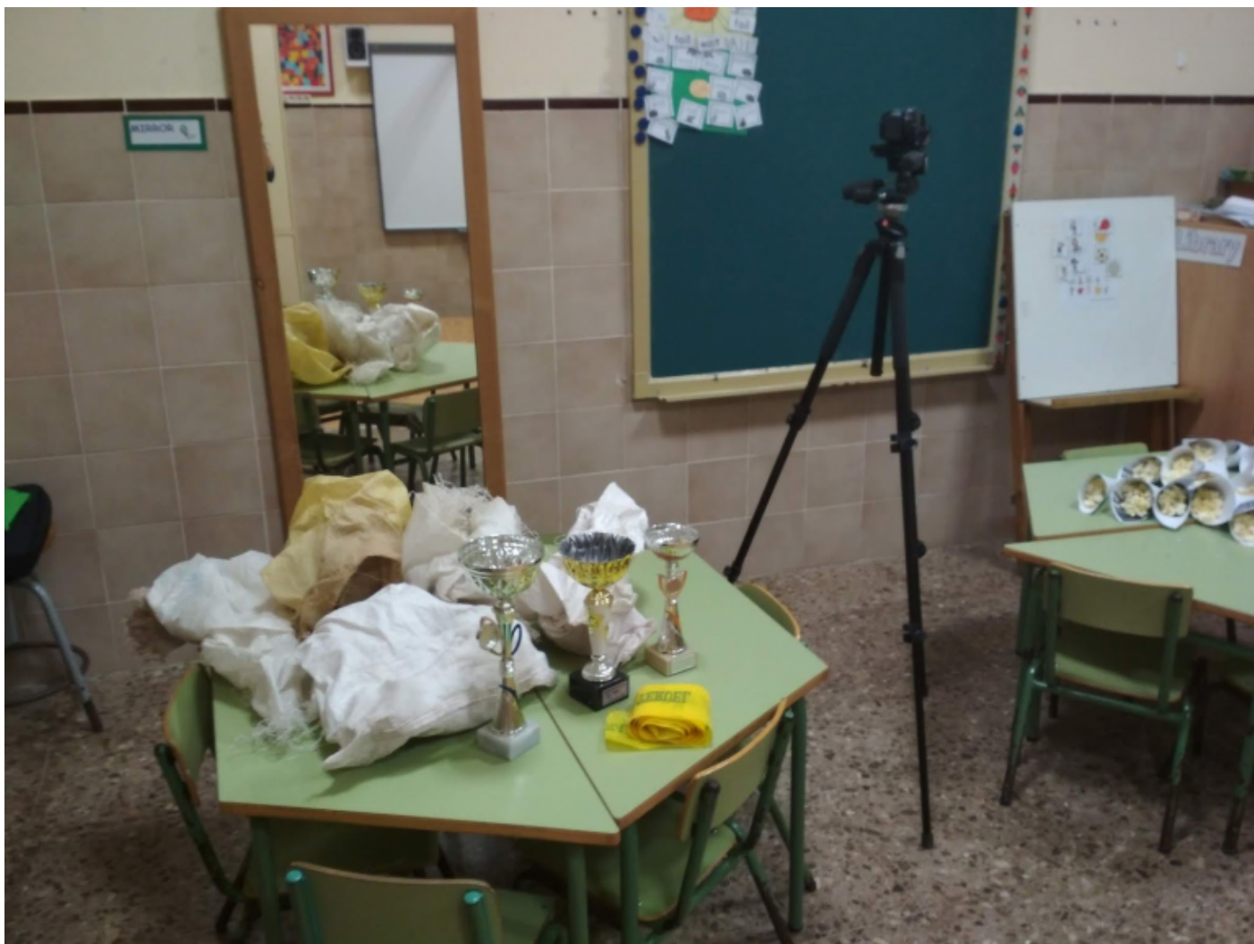
Mi aula en 24 frames. (CC-BY-NC-SA)