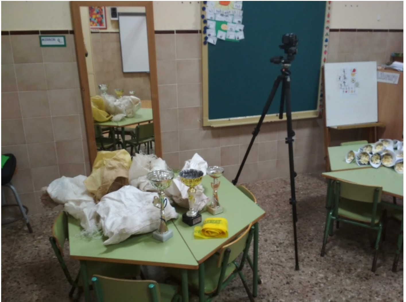
Mi aula en 24 frames. (CC-BY-NC-SA)