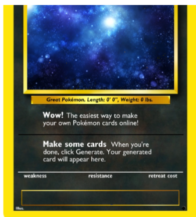
Captura de pantalla de "pokecard.net"- Elaboración propia