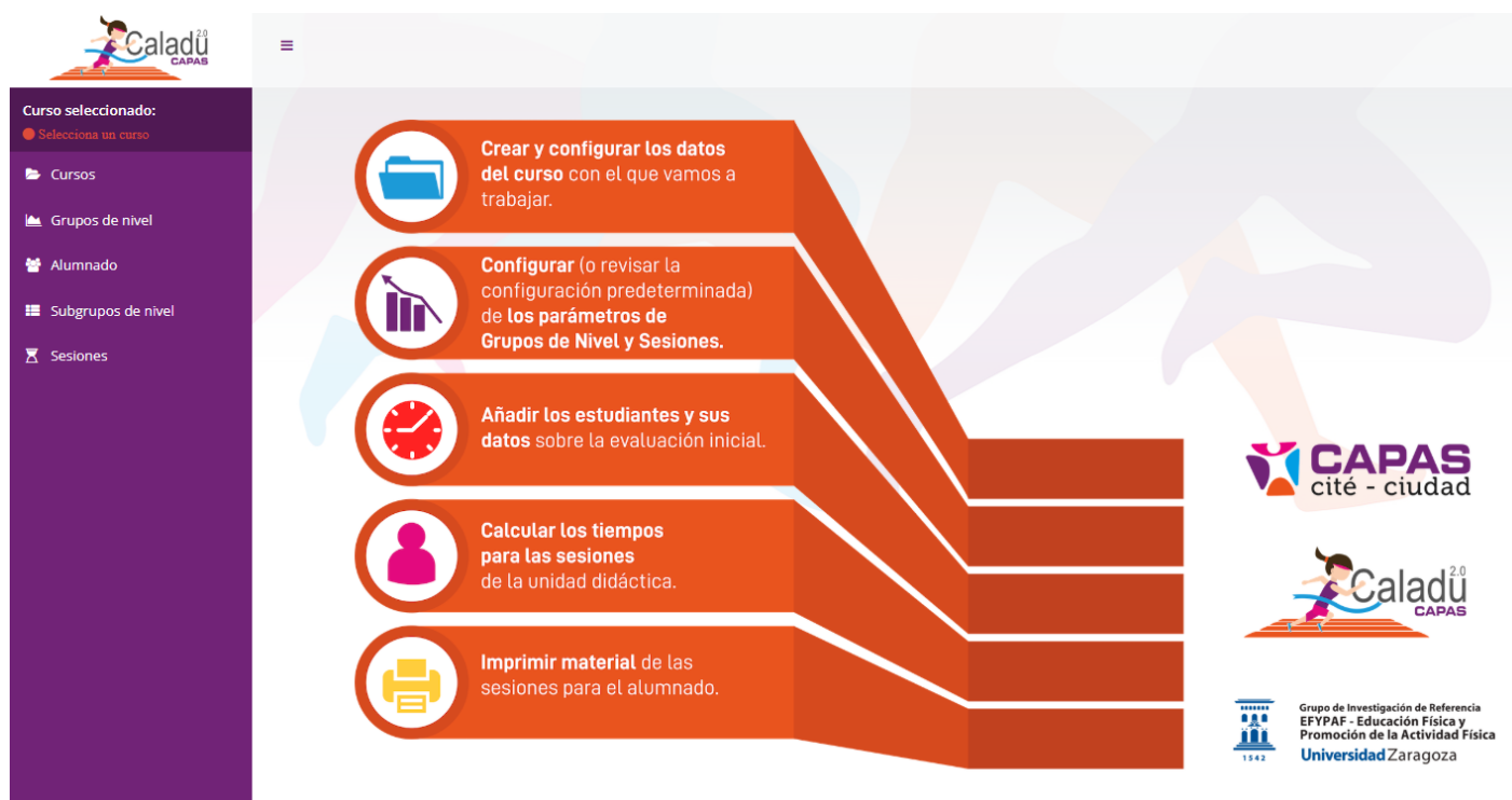
Captura de pantalla de "Caladu"- Elaboración propia

Caladu es un software creado por parte del Grupo de Investigación Educación Física y Promoción de la Actividad Física (EFYPAF) de la Universidad de Zaragoza, para ayudar al profesorado a la gestión de la unidad didáctica de carrera de larga duración (CLD) de una forma sencilla.