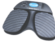
Pulsador de pie

Es un dispositivo que permite la comunicación entre la persona y la computadora. Al ejercer una mínima presión sobre el pulsador, éste emite una señal para interactuar con un programa determinado. El pulsador es ubicado de forma tal que la persona pueda accionarlo a través de un movimiento voluntario.