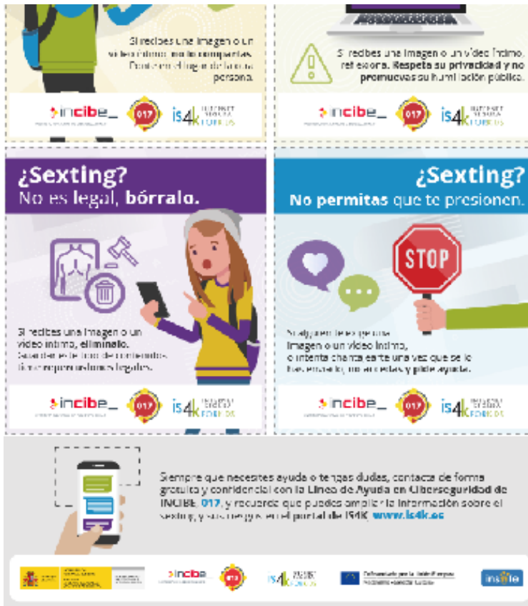
No difundas

Todos los miembros del equipo de "alumnos-ayuda" elabora una infografía de forma colaborativa, integrando elementos que capten la atención de sus compañeros mediante la utilización de aplicaciones que les resulten atractivas, como Genially, Canva o similares. En dicha presentación pueden embeber el vídeo que se muestra a continuación: