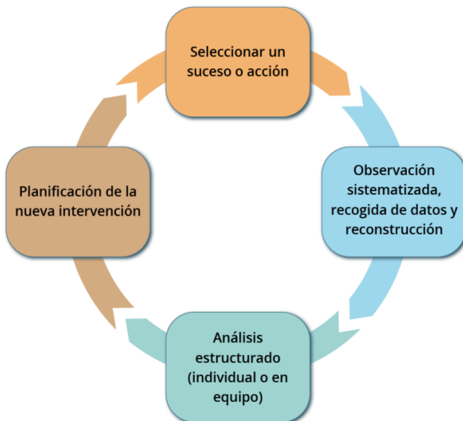
Ilustración. Práctica reflexiva. Ponencia del GTTA para la actualización del MRCDD. Creative