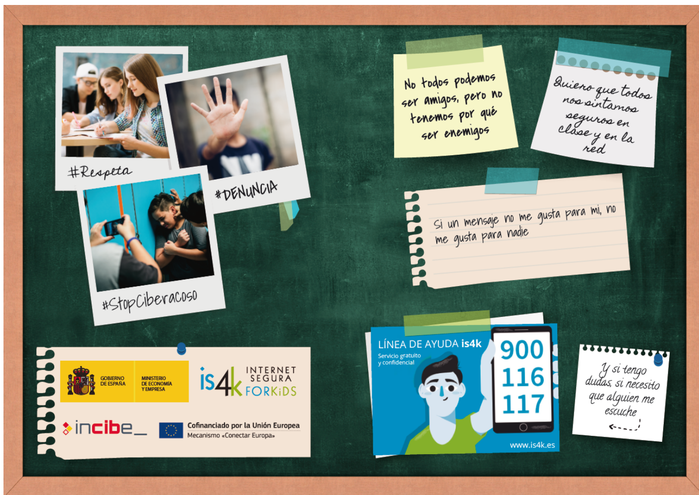
IS4K de INCIBE. Ciberacoso escolar.

INCIBE es el Instituto Nacional de Ciberseguridad y tiene una web específica para el uso seguro en menores (IS4K). En ella se puede obtener más información sobre ciberacoso escolar en el siguiente enlace .