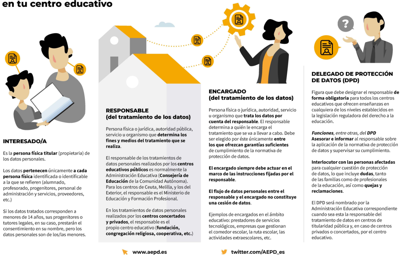
Imagen: Agencia Española de Protección de Datos. https://www.aepd.es/es/documento/quien-es-quien-centros-docentes.pdf

¿A qué nos referimos cuando hablamos de " seguridad y privacidad en Internet "? Nos referimos a la protección de datos personales , la confidencialidad de la información y la salvaguardia de la integridad de las comunicaciones en el entorno digital. A las medidas y prácticas utilizadas para proteger la información y los sistemas en línea de posibles amenazas como malware, hacking, robo de datos, phishing, entre otros. Implica la implementación de contraseñas seguras, antivirus, firewalls, actualizaciones de software y el uso de conexiones seguras.