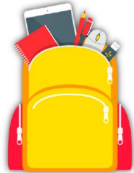
Formulario Menores, padres y educadores

Protege tu empresa resuelve consultas relacionadas con incidencias en empresas.