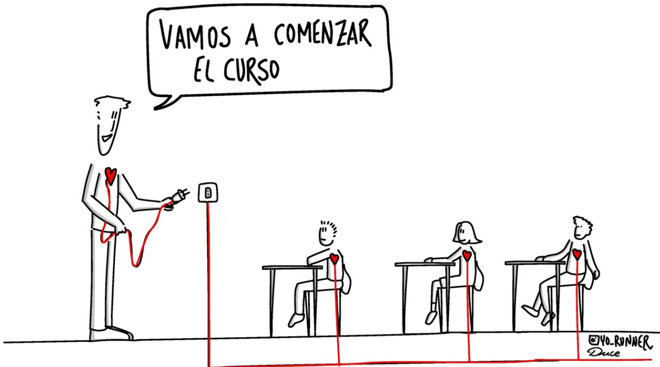
Imagen 4. La tutoría es una pieza fundamental en la detección y prevención del acoso escolar. Elaboración propia. Licencia CC BY-ND

El Plan de Acción Tutorial (PAT) es un documento que traza, a medio y largo plazo, el conjunto de acciones que se desarrollarán en el centro educativo con la finalidad de guiar, acompañar y orientar al alumnado. Este documento forma parte del proyecto educativo de centro (PEC), que es la hoja de ruta pedagógica de cada centro educativo y recoge su identidad, objetivos y organización.