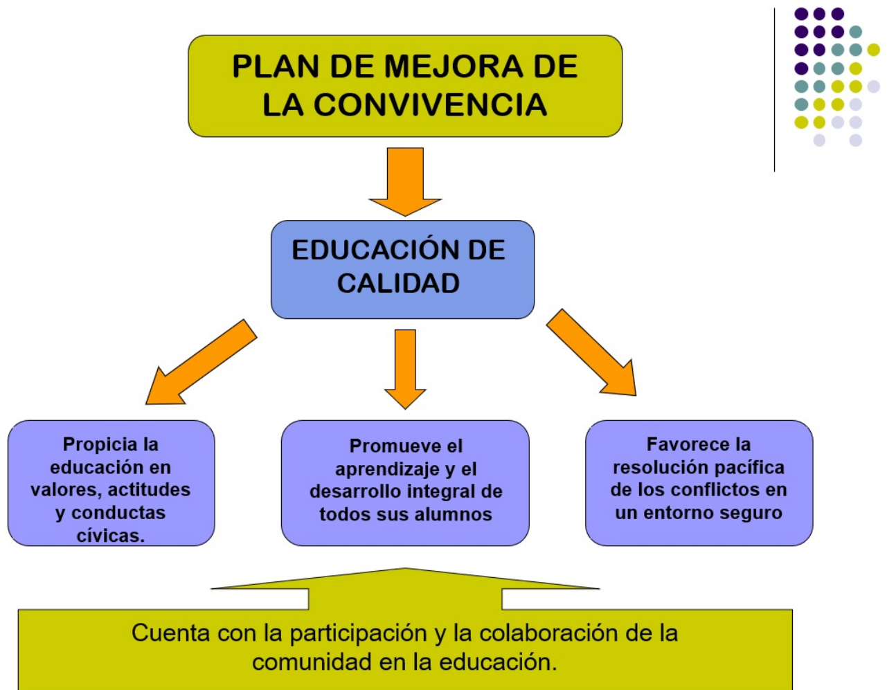
Imagen 1. Plan de mejora de la convivencia. Ballester y Calvo (2007) [1]