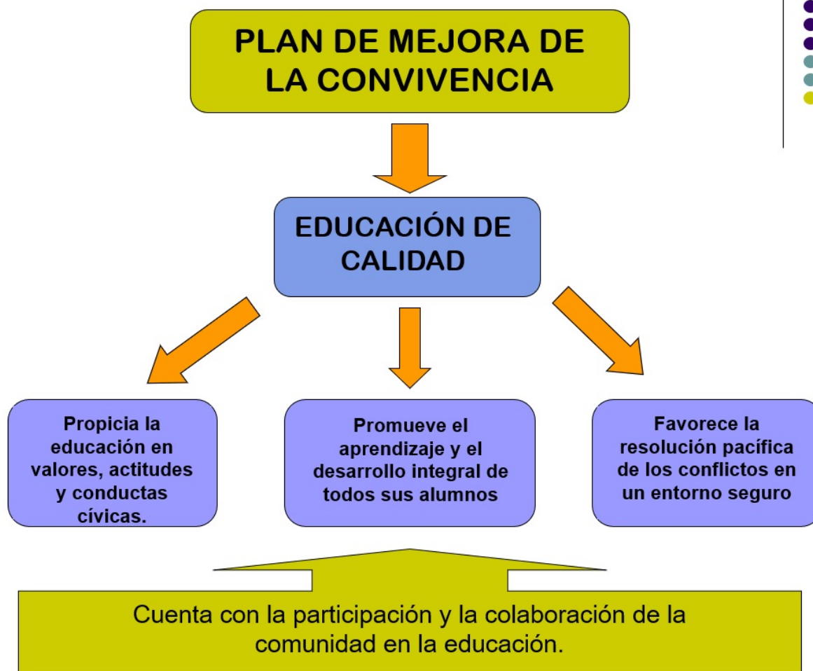
Imagen 1. Plan de mejora de la convivencia. Ballester y Calvo (2007) [1]

[1] BALLESTER, F. y CALVO, A. (2007) Cómo elaborar planes para la mejora de la convivencia. Madrid. EOS