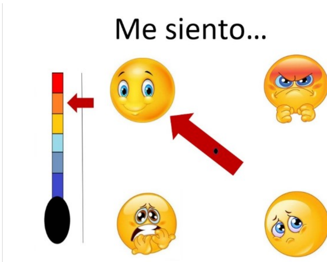
Imagen 6. “Emocionómetro”. Elaboración propia.

Unas flechas con velcro por detrás serán suficientes para que el alumno o alumna nos indique qué emoción está sintiendo y en qué intensidad.