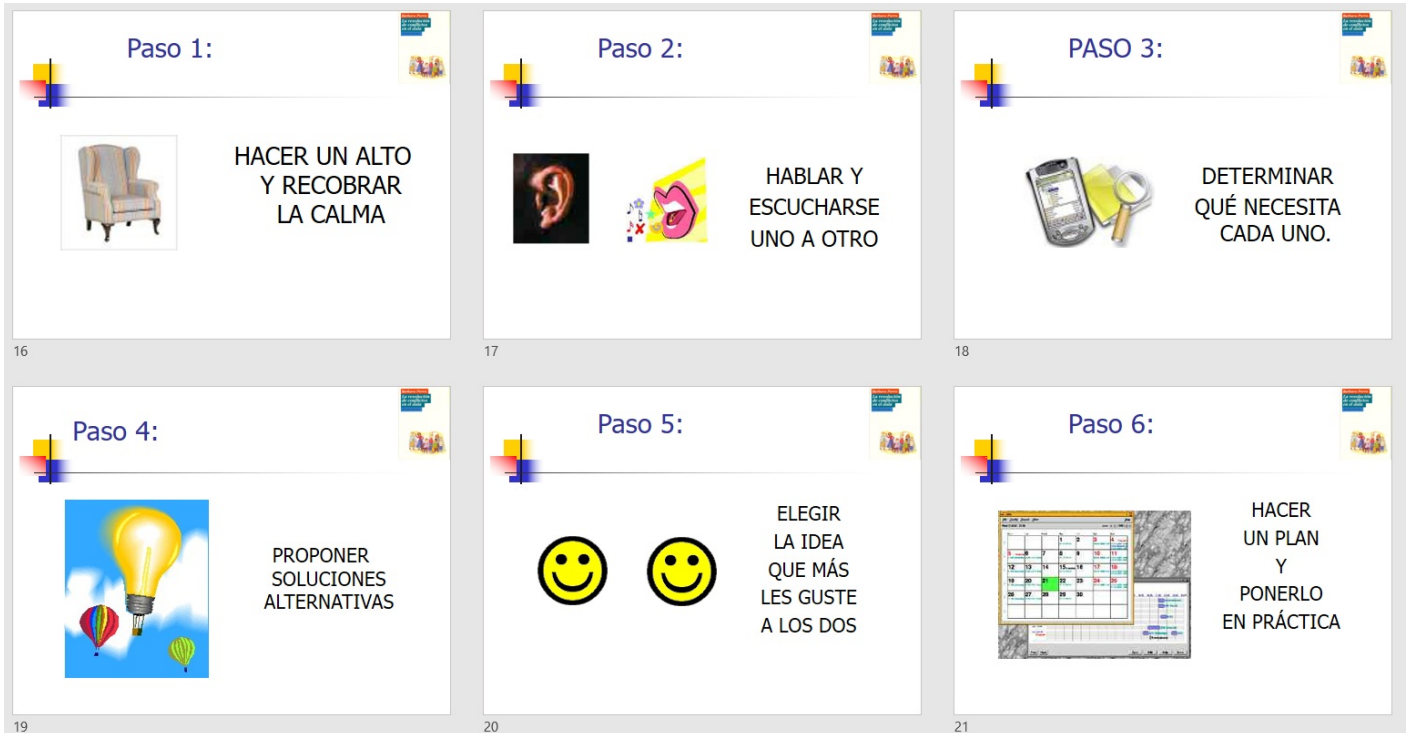
Imagen 9. Seis pasos para la negociación. Elaboración propia