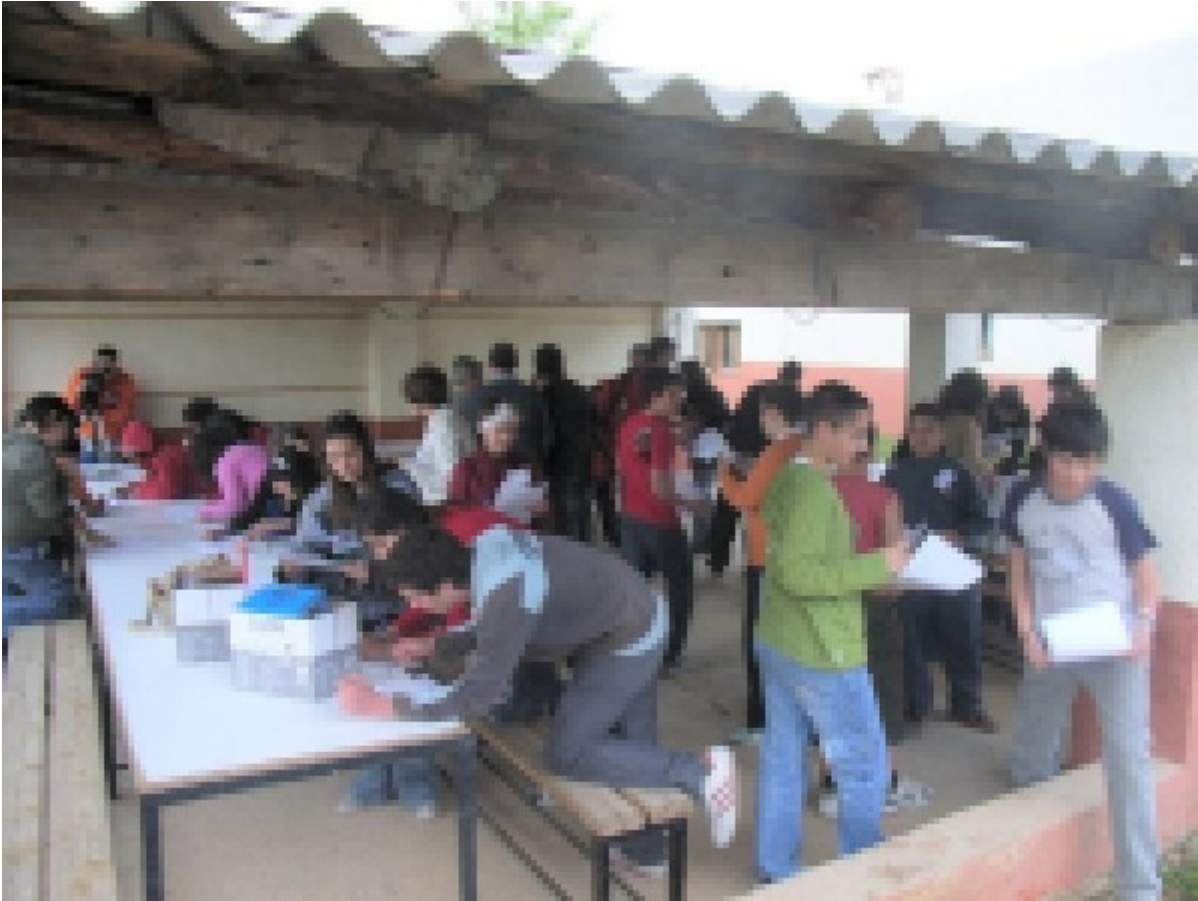
Imagen 8. Actividad de tutoría. Elaboración propia.

Siguiendo a Juan Carlos Torrego [1] , como elementos a desarrollar en estas etapas, en relación con la convivencia, destacaremos: