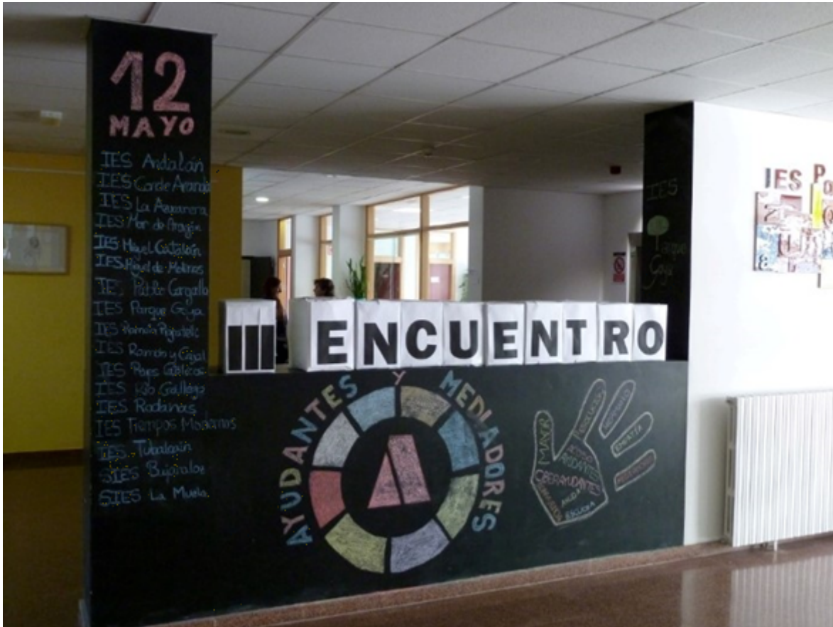
Imagen B3_17: Encuentros para intercambiar experiencias entre alumnos. Elaboración propia

Es muy interesante que los Centros que trabajan en Convivencia se hermanen con otros centros cercanos que también la trabajan. Refuerza mucho a los profesores y sobre todo a los alumnos, que trabajan en prevención de la convivencia, organizar encuentros en los que intercambiar experiencias. La Administración cuenta con recursos en formación: cursos, seminarios, material y expertos que pueden asesorar y resolver dudas o problemas que pueden surgir durante el proceso. Un Seminario para la Convivencia (a nivel ayuntamiento, comarca, provincia o comunidad autónoma) con un miembro de cada centro que trabaja en convivencia es un instrumento útil para el intercambio de ideas, información y formación. Un Seminario así puede organizar y planificar un Encuentro de Alumnos Ayudantes anual (de nuevo a nivel local, provincial, autonómico) con talleres, ponentes externos y convivencia entre alumnos ayudantes. Estos encuentros son muy importantes para reforzar la estructura, crear redes, concienciar.