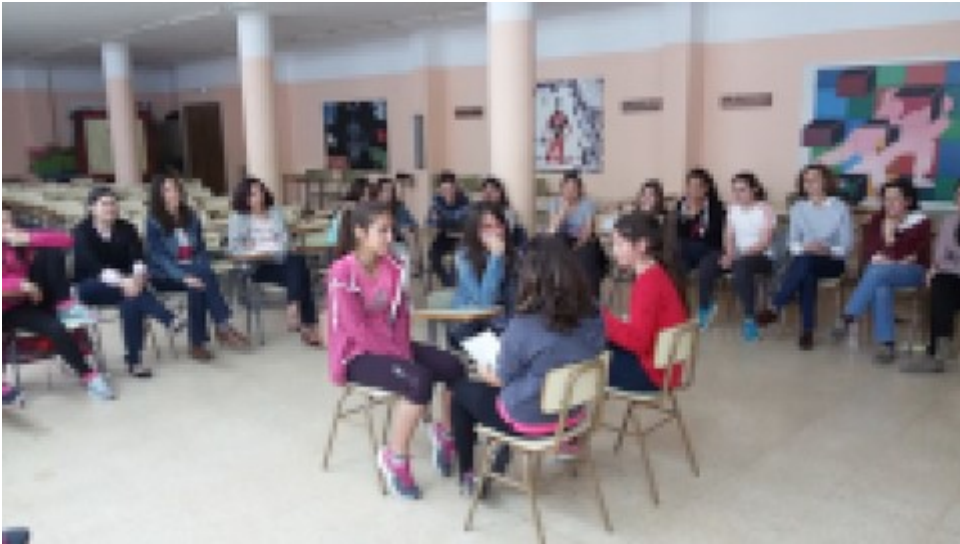
Imagen 12. Implementación de un Sistema de ayuda entre iguales. Elaboración propia

Educación para la convivencia debe comenzar a edades tempranas, en las etapas escolares de infantil y primaria. Una de las primeras y más interesantes aportaciones en este campo fue el libro " Stop Bullying. Las mejores estrategias para prevenir y frenar el acoso escolar " de Nora Rodríguez, publicado en 2006. Hay una reflexión acerca de la ventaja de trabajar estrategias antibullying en edades tempranas y el nuevo papel para los profesores. El libro describe detalladamente estrategias en educación infantil: