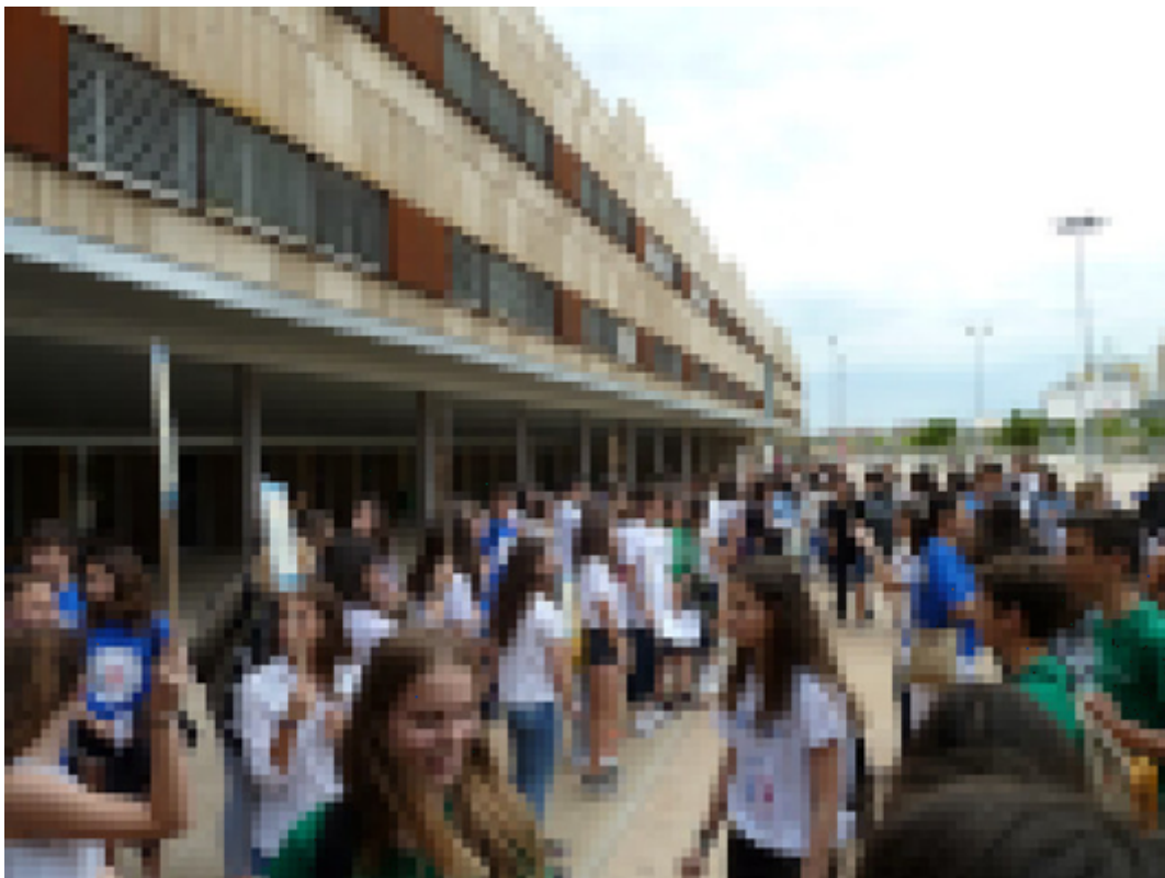
Imagen B3_18: Encuentros para intercambiar experiencias entre alumnos. Elaboración propia

Tienes aquí un ejemplo de Encuentro de Alumnos Ayudantes a nivel provincial de secundaria, con programa, talleres, etc. En la misma web puedes ver los Encuentros de Alumnos Ayudantes desde 2015 hasta 2023. Se han hecho tan numerosos que actualmente se realizan los encuentros en grupos de 3 centros.