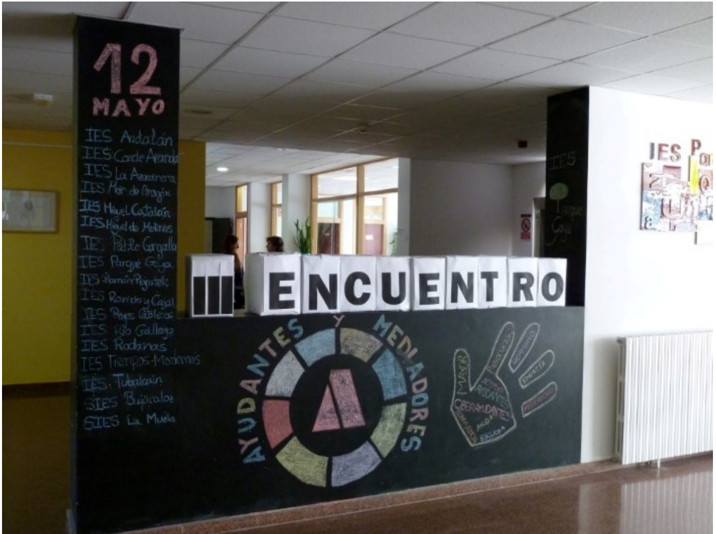
Imagen 14. Encuentros para intercambiar experiencias entre alumnos. Elaboración propia

Es muy interesante que los Centros que trabajan en Convivencia se hermanen con otros centros cercanos que también la trabajan. Refuerza mucho a los profesores y sobre todo a los alumnos, que trabajan en prevención de la convivencia, organizar encuentros en los que intercambiar experiencias. La Administración cuenta con recursos en formación: cursos, seminarios, material y expertos que pueden asesorar y resolver dudas o problemas que pueden surgir durante el proceso. Un Seminario para la Convivencia (a nivel ayuntamiento, comarca, provincia o comunidad autónoma) con un miembro de cada centro que trabaja en convivencia es un instrumento útil para el intercambio de ideas, información y formación. Un Seminario así puede organizar y planificar un Encuentro de Alumnos Ayudantes anual (de nuevo a nivel local, provincial, autonómico) con talleres, ponentes externos y convivencia entre alumnos ayudantes. Estos encuentros son muy importantes para reforzar la estructura, crear redes, concienciar.