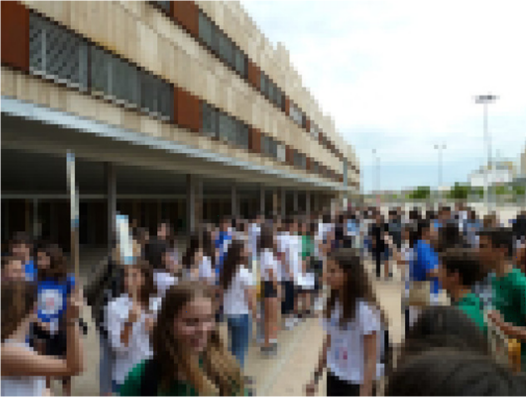
Imagen B3_18: Encuentros para intercambiar experiencias entre alumnos.

Tienes aquí un ejemplo de Encuentro de Alumnos Ayudantes a nivel provincial de secundaria, con programa, talleres, etc. En la misma web puedes ver los Encuentros de Alumnos Ayudantes desde 2015 hasta 2023. Se han hecho tan numerosos que actualmente se realizan los encuentros en grupos de 3 centros.