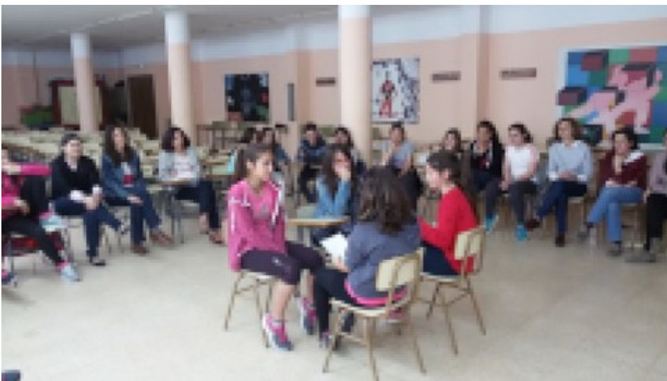
Imagen 12. Implementación de un Sistema de ayuda entre iguales. Elaboración propia

Educación para la convivencia debe comenzar a edades tempranas, en las etapas escolares de infantil y primaria. Una de las primeras y más interesantes aportaciones en este campo fue el libro "Stop Bullying. Las mejores estrategias para prevenir y frenar el acoso escolar" de Nora Rodríguez, publicado en 2006. Hay una reflexión acerca de la ventaja de trabajar estrategias antibullying en edades tempranas y el nuevo papel para los profesores. El libro describe detalladamente estrategias en educación infantil: