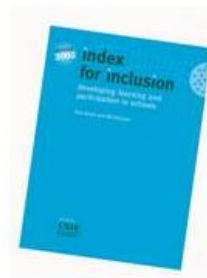
Portada de los Materiales de INDEX publicada en Reino Unido.

En la actualidad, existe una versión para escuelas infantiles (Booth, Ainscow y Kingston, 2006) que ha sido adaptado al contexto español por el Instituto Universitario de Integración en la Comunidad (INICO), denominado « Index para la Inclusión. Desarrollo del juego, el aprendizaje y la participación en Educación Infantil ».