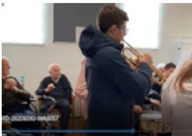
Imagen 25. alumnado participando en la actividad en la residencia. Elaboración propia.