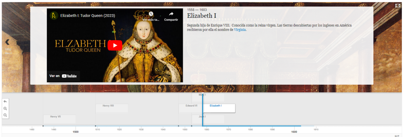
Imagen ejemplo Timeline.

Si deseas crear contenido h5p en Wordpress, puedes ver como se hace en este capítulo .