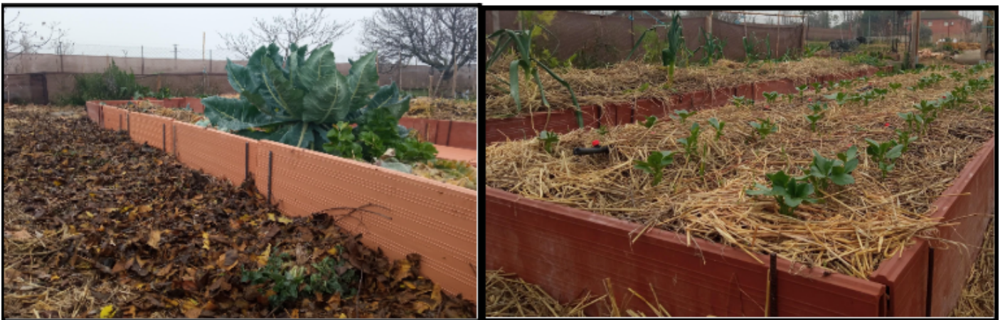
Izquierda: Pasillo entre bancales acolchado con hojas de platanera ( Platanus orientalis ) y césped triturada . Derecha: Bancal elevado con rasillones acolchado con paja.

Es importante no sólo acolchar las zonas de cultivo, sino también las zonas de paso, idealmente con corteza de pino o pinaza, ya que favorece la red de hifas de todo el subsuelo de nuestra huerta. Evitar este tipo de acolchado dentro de la superficie de cultivo, ya que al tener un alto porcentaje en carbono, actúa como “secuestrador” de nitrógeno, lo cual repercutiría en las especies a cultivar (excepto leguminosas). Además, tardan bastante más tiempo en descomponerse que otros tipos de acolchado.