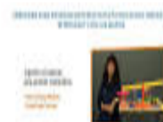
Fig. 16. Interfaz de Alertas en Google