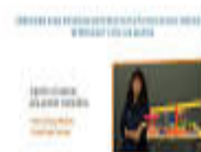
Fig. 16. Interfaz de Alertas en Google