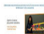
Fig. 16. Interfaz de Alertas en Google