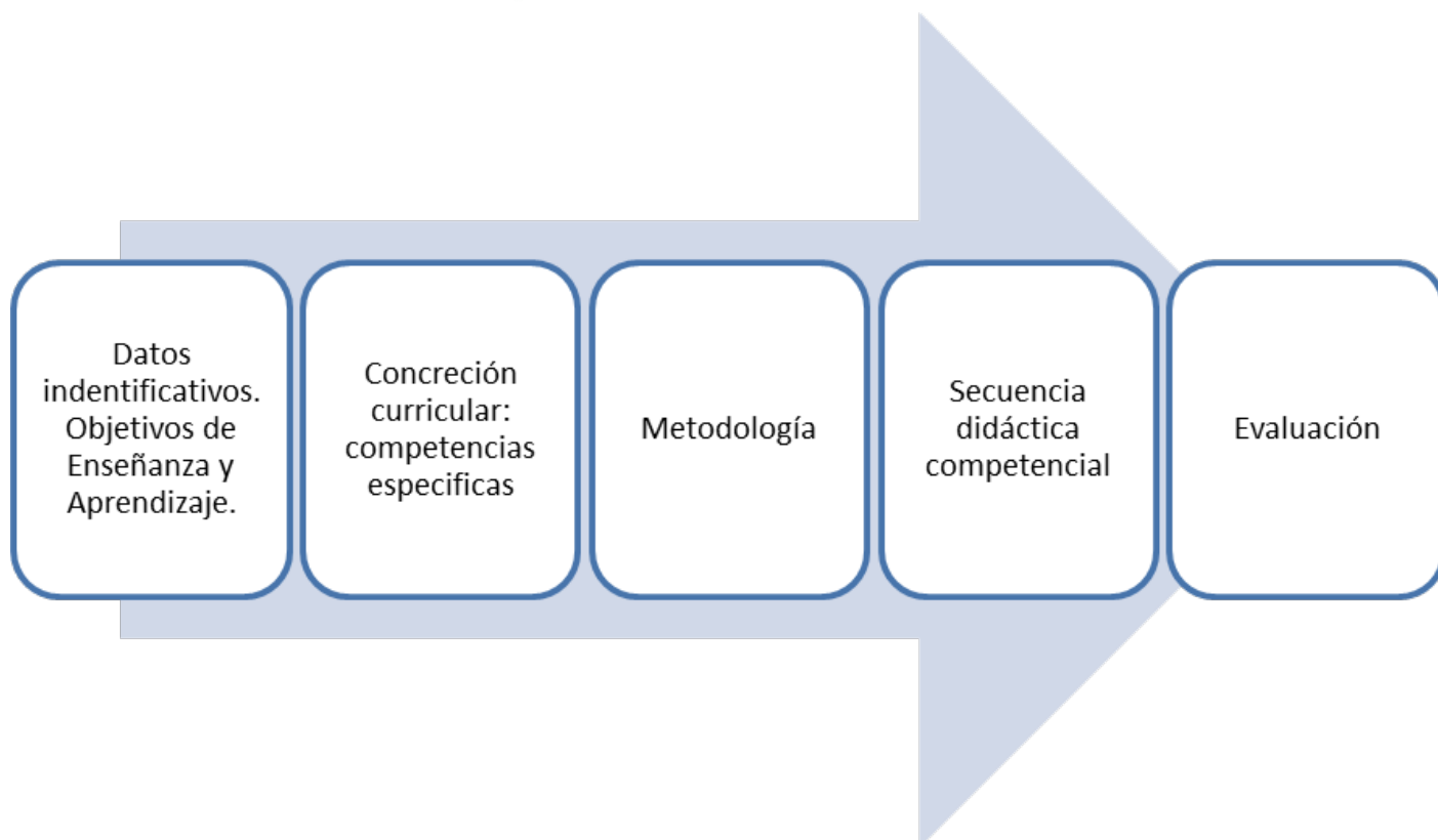
Imagen 12 - Figura 11: Elaboración propia.

Adjunto un ejemplo de situación de aprendizaje que se puede descargar en la página del Ministerio de Educación: https://auladelfuturo.intef.es/recursos/