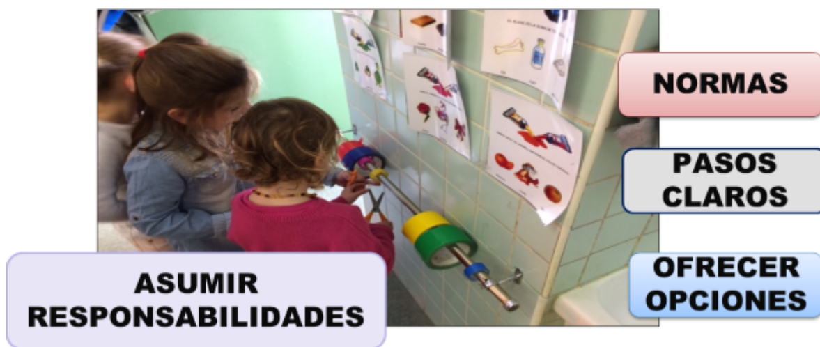
Imagen - Figura 7: Elaboración propia.

El PEC contendrá el Reglamento de Régimen Interior y las normas de convivencia del centro de acuerdo con el Decreto 73/2011, de 22 de marzo, del Gobierno de Aragón, por el que se establece la Carta de derechos y deberes de los miembros de la comunidad educativa, y en la Ley 8/2012, de 13 de diciembre, de autoridad del profesorado en la Comunidad Autónoma de Aragón. Además, el PEC deberá incluir el Plan de Convivencia y el Plan de la Igualdad, estructurados de acuerdo con lo establecido respectivamente en los artículos 10 y 11 de la Orden ECD/1003/2018 de 7 de junio, por la que se determinan las actuaciones que contribuyen a promocionar la convivencia, igualdad y la lucha contra el acoso escolar en la comunidad educativa aragonesa (BOA de 18 de junio).