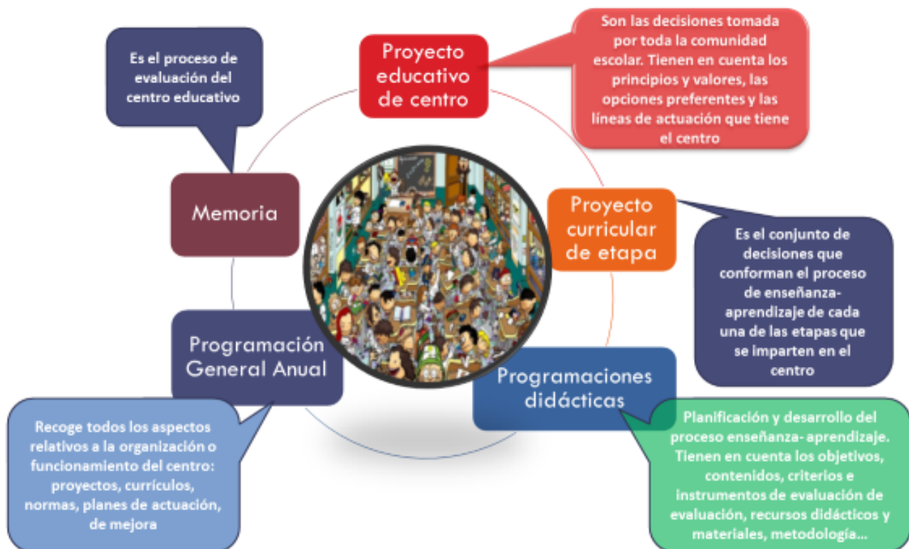
Imagen - Figura 8: Elaboración propia.

Asimismo, el PEC recogerá un Plan de mejora (que será establecido anualmente) y debe plantear una Estrategia Digital de Centro. Un plan que ya existía en anteriores normativas, pero que la situación de emergencia sanitaria desde 2020 por el COVID 19 se ha puesto de manifiesto las graves deficiencias en este sentido.