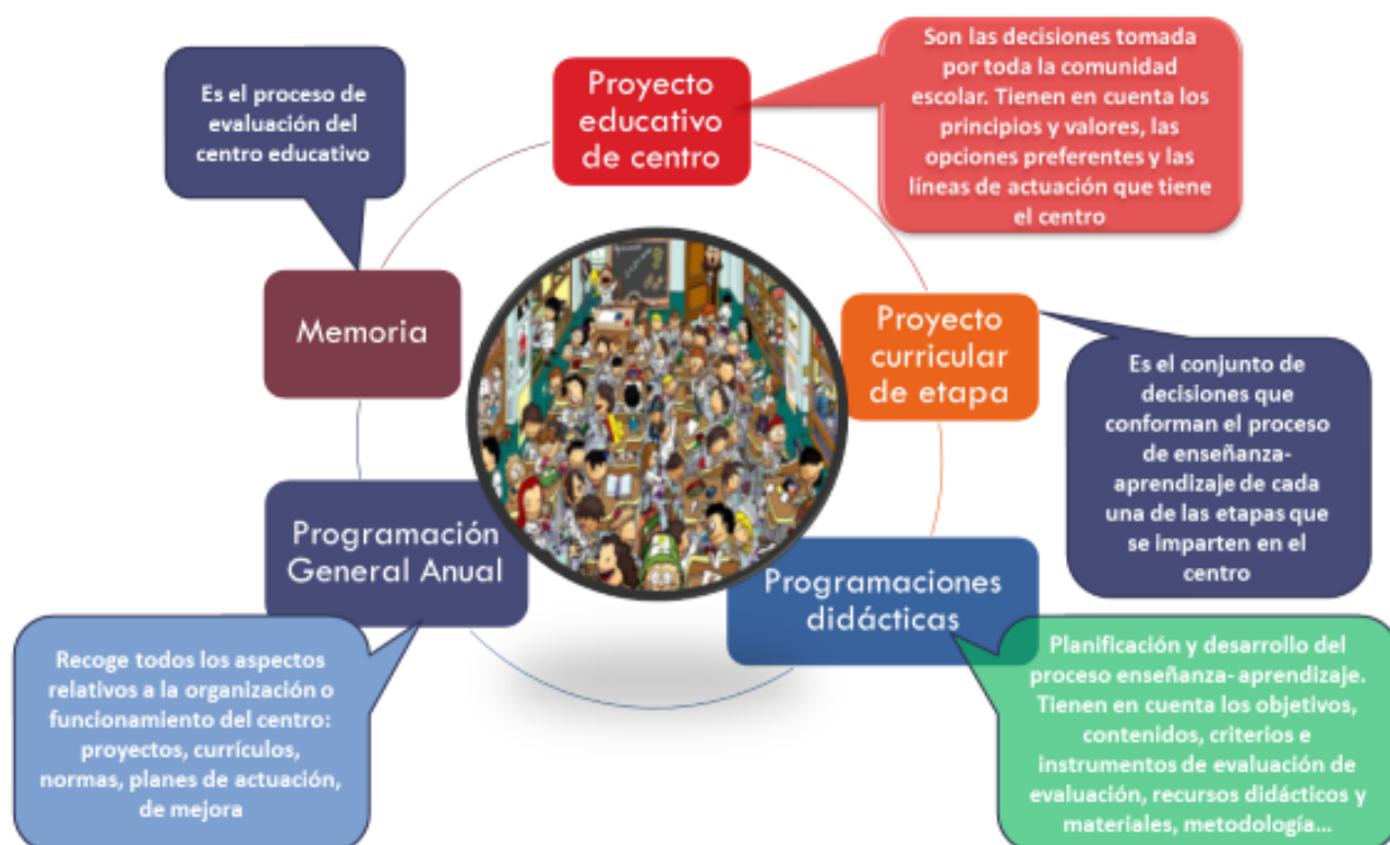
Imagen - Figura 8: Elaboración propia.

Asimismo, el PEC recogerá un Plan de mejora (que será establecido anualmente) y debe plantear una Estrategia Digital de Centro. Un plan que ya existía en anteriores normativas, pero que la situación de emergencia sanitaria desde 2020 por el COVID 19 se ha puesto de manifiesto las graves deficiencias en este sentido.