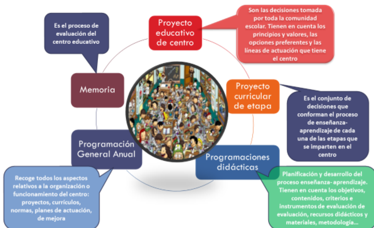
Imagen - Figura 8: Elaboración propia.

Asimismo, el PEC recogerá un Plan de mejora (que será establecido anualmente) y debe plantear una Estrategia Digital de Centro. Un plan que ya existía en anteriores normativas, pero que la situación de emergencia sanitaria desde 2020 por el COVID 19 se ha puesto de manifiesto las graves deficiencias en este sentido.