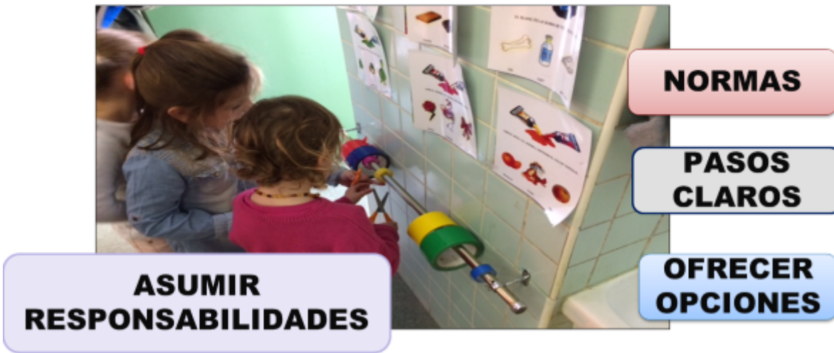
Imagen - Figura 7: Elaboración propia.

El PEC contendrá el Reglamento de Régimen Interior y las normas de convivencia del centro de acuerdo con el Decreto 73/2011, de 22 de marzo, del Gobierno de Aragón, por el que se establece la Carta de derechos y deberes de los miembros de la comunidad educativa, y en la Ley 8/2012, de 13 de diciembre, de autoridad del profesorado en la Comunidad Autónoma de Aragón. Además, el PEC deberá incluir el Plan de Convivencia y el Plan de la Igualdad, estructurados de acuerdo con lo establecido respectivamente en los artículos 10 y 11 de la Orden ECD/1003/2018 de 7 de junio, por la que se determinan las actuaciones que contribuyen a promocionar la convivencia, igualdad y la lucha contra el acoso escolar en la comunidad educativa aragonesa (BOA de 18 de junio).