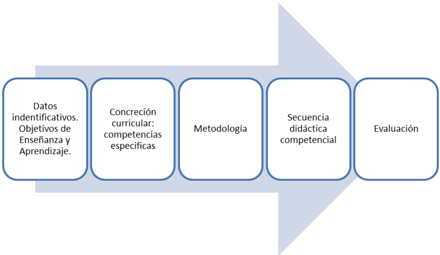
Imagen 12 - Figura 11: Elaboración propia.

Adjunto un ejemplo de situación de aprendizaje que se puede descargar en la página del Ministerio de Educación: https://auladelfuturo.intef.es/recursos/