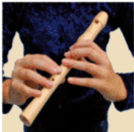
FA de "horquilla"