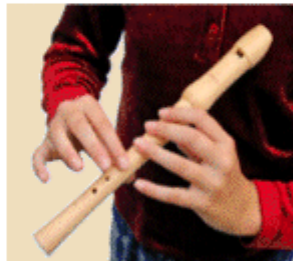
FA con índice