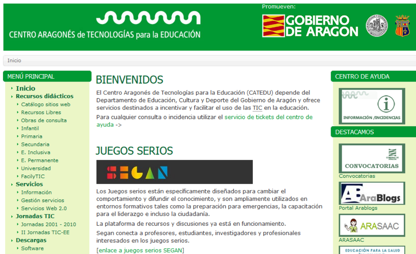
Fig 2.21 _Pantalla inicial de _

En la página principal podemos encontrar en Menú principal recursos didácticos