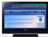
Ortografía.- Ay,hay,ahí. 1:52 Vistas: 1,605

Administración Arquitectura Artes Biología Comunicaciones Contabilidad Deportes Derecho Economía Educación Filosofía Física Gastronomía Geografía Geología Historia Idiomas Informática Ingeniería Literatura