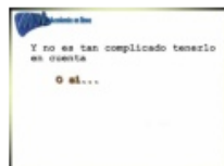
Acentos y signos