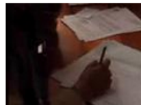
Ortografía 1:28 Vistas: 39,540