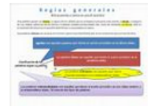
REGLAS DE ACENTUACION 5:48 Vistas: 34,824