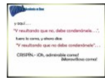
Acentos y signos de puntuación 9:40 Vistas: 19,827