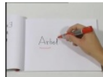
Normas de acentuación 6:53 Vistas: 124,465