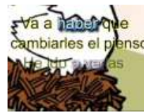
Ortografía: A ver - Haber 2:14 Vistas: 2,325