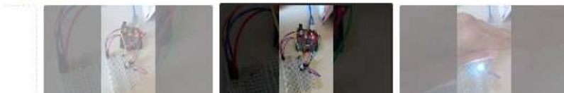
imagen que refleje el contenido del vídeo. Una buena miniatura destaca y llama la os. Más información