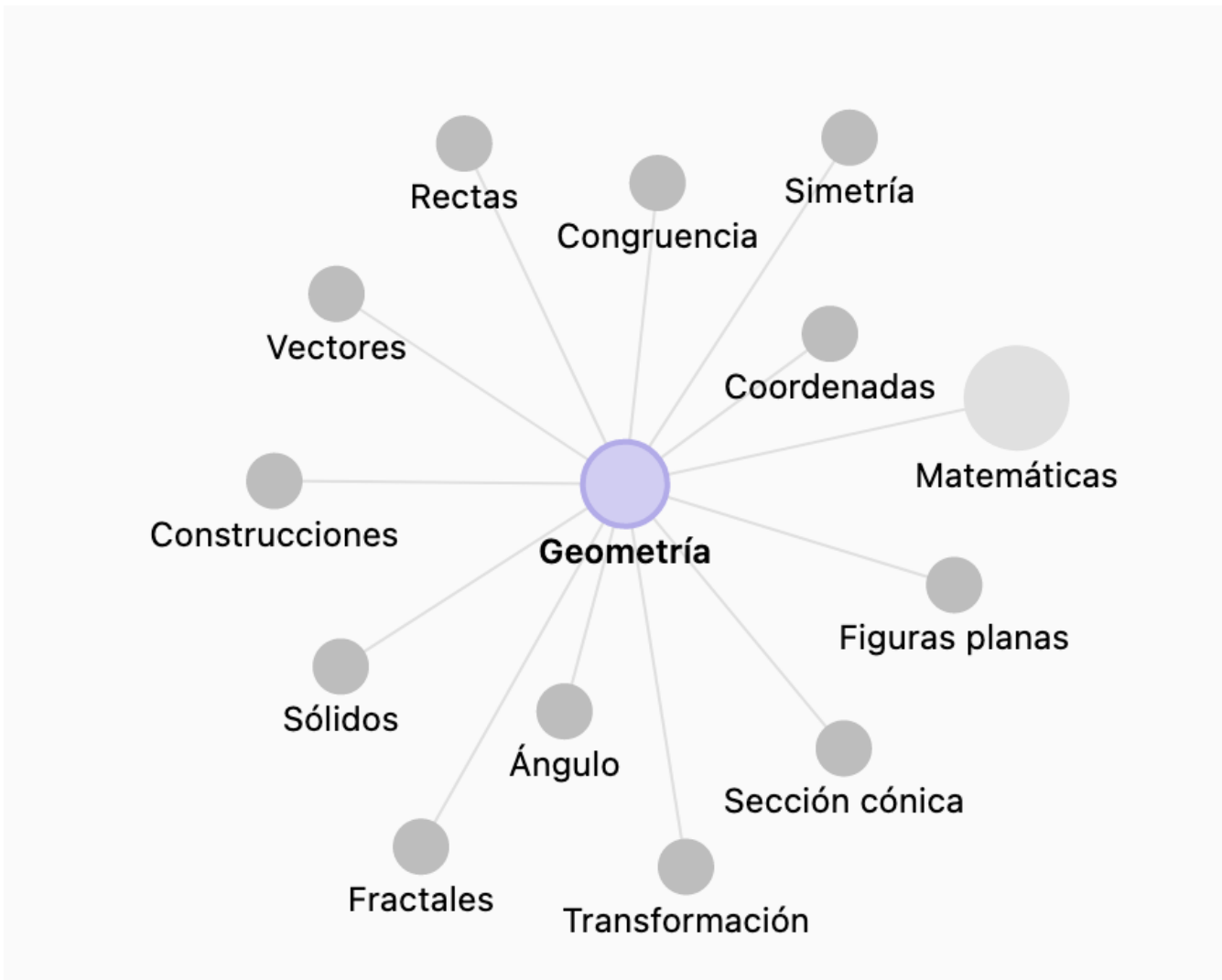
Fig. 1-4 Acceso a aplicaciones sobre temas de Geometría

El problema radica en la dificultad de seleccionar una aplicación de las muchas que salen en cada apartado porque no hay un criterio concreto ni tampoco una selección previa. Aunque está bien organizado, al final acaba siendo un bosque en el que es muy difícil encontrar lo que buscamos. Luego daremos un listado (no exhaustivo) de autores de reconocida solvencia y calidad y también de alguna recopilación.