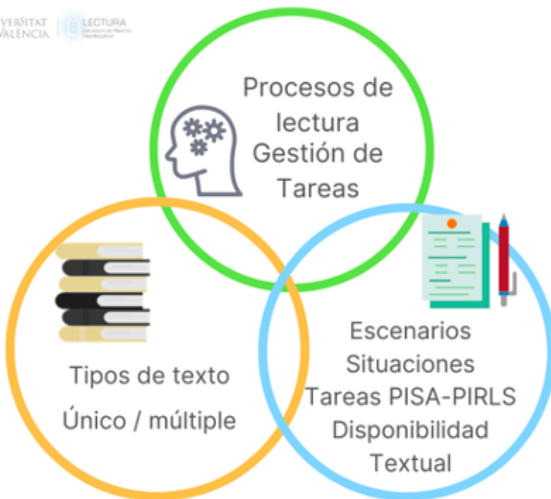
Figura 9. Enumeración de los factores asociados al Lector, Texto y Contexto que se van a desarrollar.