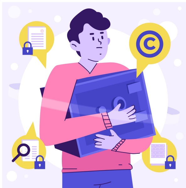
Imagen de pikisuperstar en Freepik

3. Transparencia : debe cumplirse con los deberes de información de los artículos 12 al 14 del RGPD, en los que se prevé concretamente la información mínima que debe facilitarse a los interesados en todo tratamiento, y garantizar que toda información y comunicación relativa al tratamiento sea fácilmente accesible y fácil de entender y que se utiliza un lenguaje sencillo y claro. Así mismo, debe permitirse el acceso a la información , en los términos previstos en el RGPD.