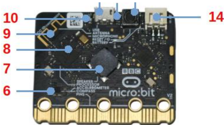
Reverso de la placa BBC micro:bit.