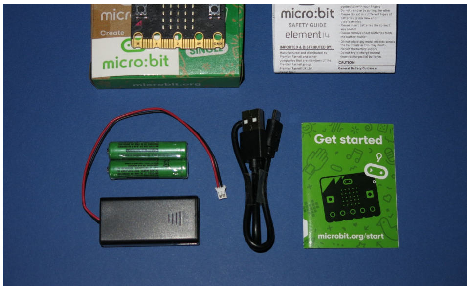
Contenido de un kit de inicio.