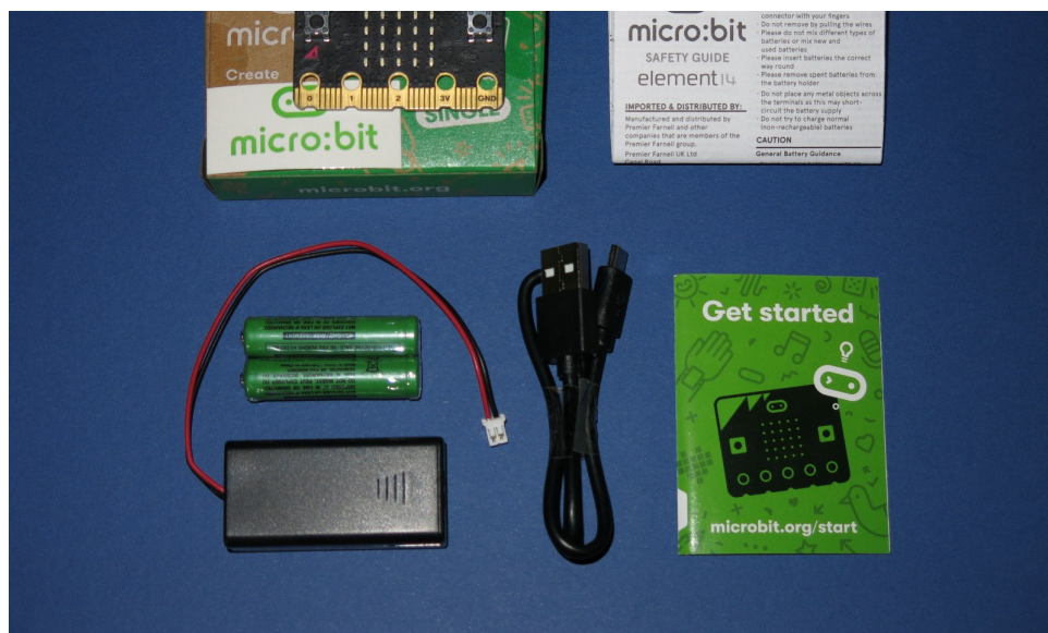
Contenido de un kit de inicio.