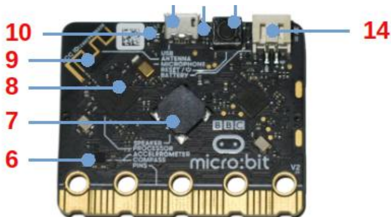
Reverso de la placa BBC micro:bit.