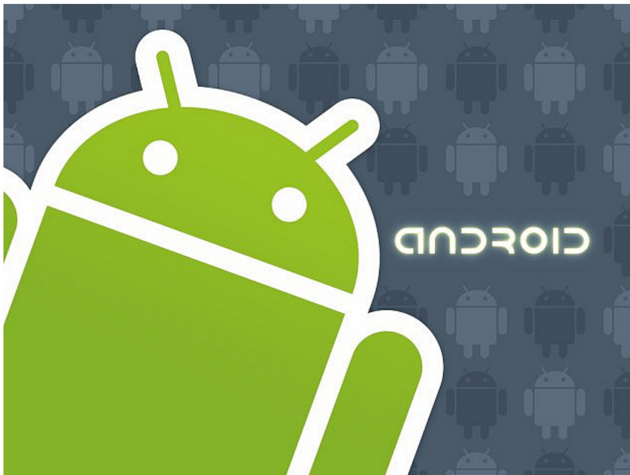
Imagen de Android