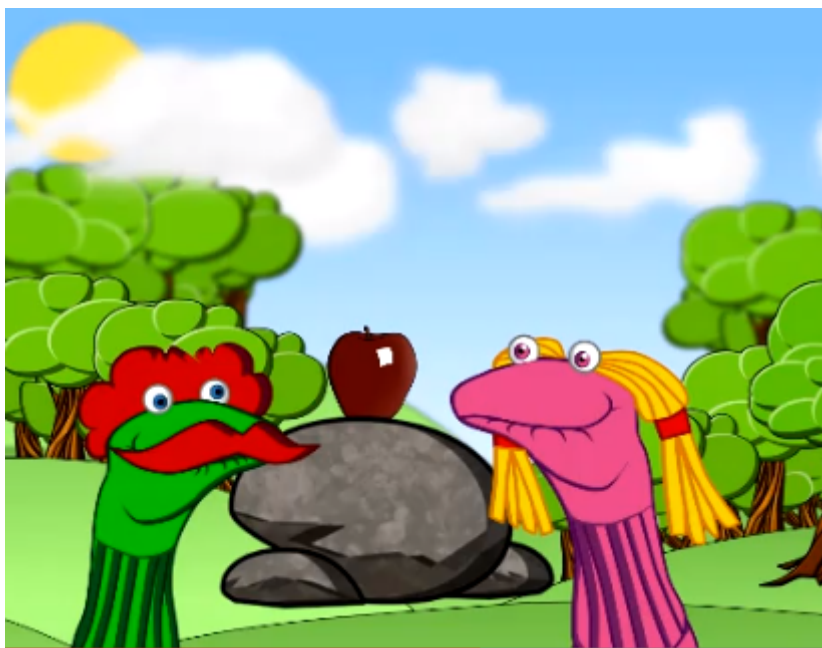
Captura del vídeo The Apple Sockpuppet

La app StoryKit permite crear un libro multimedia editando, reescribiendo y adaptando libros clásicos como Los tres cerditos o creando libros propios. Nuestro alumnado podrá dibujar con la app, subir imágenes, grabar su voz y añadir texto. Aquí podéis ver una historia creada con esta app .