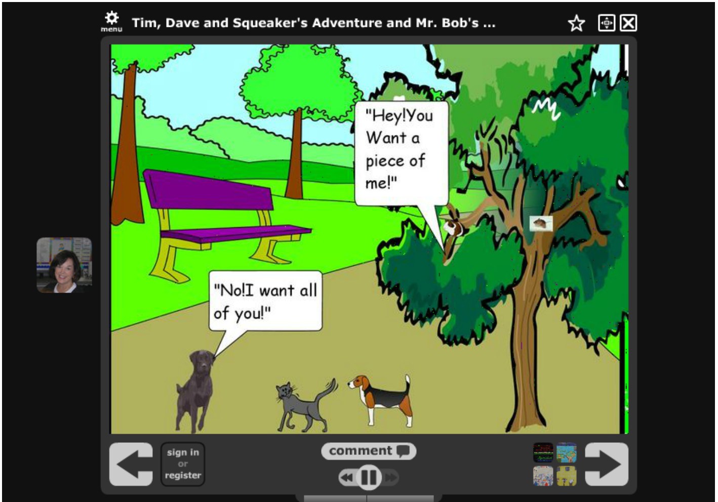
Captura de Voicethread Progressive Story: Tim, Dave and Squeaker's Adventure and Mr. Bobs Rescue (Ditzler, 2011)