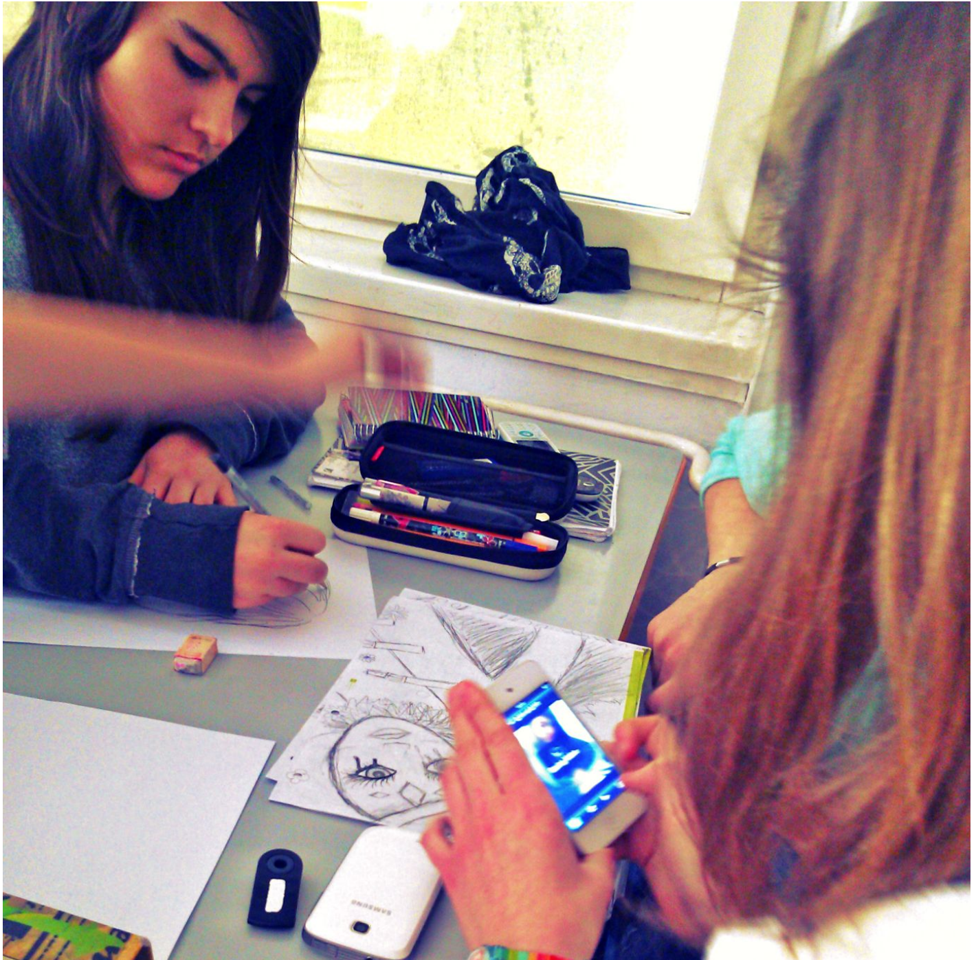
Imagen de los alumnos de Eslovenia haciendo una lluvia de ideas para realizar su comercial.

Se les permitió hacer una lluvia de ideas, como en la imagen: